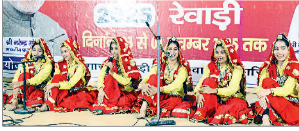
रेवाड़ी। समूह गायन की प्रस्तुति देते हुए टीम, गुण डांस की प्रस्तुति देते हुए छात्रों तथा समापन समारोह में मुख्य अतिथि व रजिस्ट्रार के साथ महोत्सव के आयोजक और सदस्य।