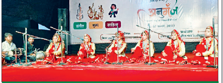
युवा महोत्सव में हरियाणवी गुप सॉन्ग पेश करती छात्राएं

हरिभूमि न्यूज >>> रेवाड़ी केएलपी कॉलेज में बुधवार को इंदिरा गांधी विश्वविद्यालय मीरपुर के तीन दिवसीय क्षेत्रीय युवा महोत्सव 'अनुगूंज' का शानदार आगाज हो गया। 7 नवंबर तक चलने वाले महोत्सव में जिले के 21 कॉलेजों के युवा भाग ले रहे हैं। युवा महोत्सव के विभिन्न इवेंट के लिए कॉलेज में सात स्टेज तैयार किए गए हैं। महोत्सव में पांच वर्गों की 42