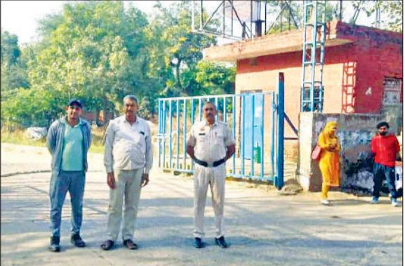
महेंद्रगढ़। बस स्टैंड के मुख्यद्वार पर तैनात रोडवेज के कर्मचारी व पुलिसकर्मी।

बता दें कि ऑटो व बस के कारण शहर के मुख्य बस अड्डे के सामने जाम की स्थिति बनी रहती थी। कई बार तो जाम ऐसे लगता है कि दुपहिया व चार पहिया वाहन तो क्या, पैदल चलने वालों को भी