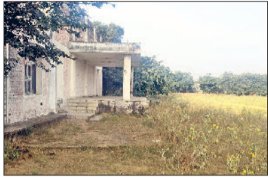
रेवाड़ी। खेल स्टेडियम के भवन तक ऊगी खरपतवार, स्टेडियम में फेली कंट्रीली झाड़ियां तथा खेल स्टेडियम के मैदान में ऊगी खरपतवार।