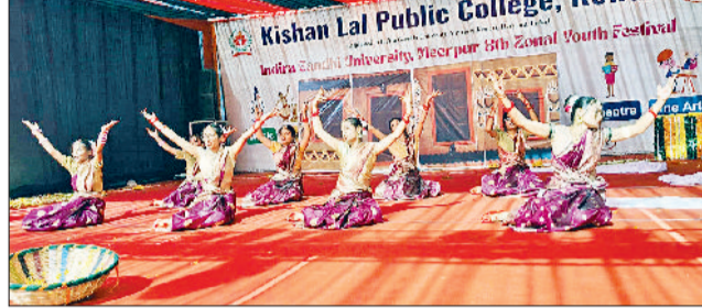
युवा महोत्सव में गुप डांस पेश करती टीम