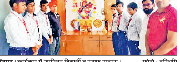
महेंद्रगढ़। कार्यक्रम में उपस्थित विद्यार्थी व स्टाफ सदस्य।