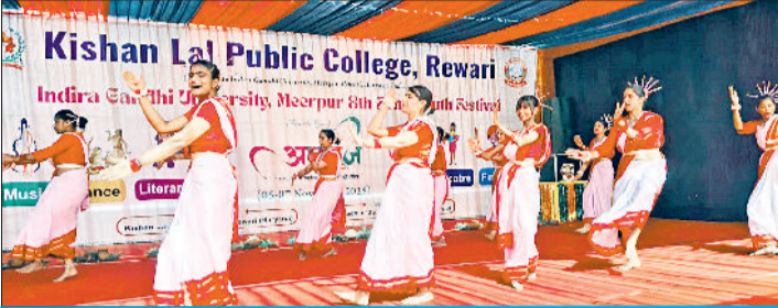
युवा महोत्सव में गुप डांस पेश करती टीम