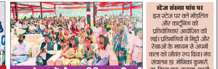
युवा महोत्सव में मौजूद अतिथिगण व विद्यार्थी