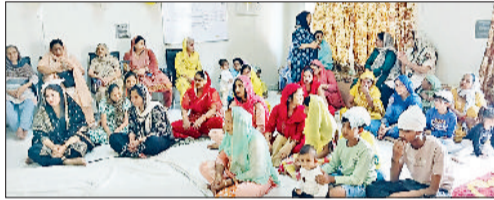
रेवाड़ी। गुरुद्वारों में आयोजित कार्यक्रम में मौजूद बच्चे व महिलाएं।

कार्तिक पूर्णिमा के अवसर पर बुधवार को शहर के सभी गुरुद्वारों में गुरुनानक देव जी का 556वां प्रकाश पर्व हर्षोल्लास के साथ मनाया गया। गुरुद्वारों में बुधवार को साध-संगत की ओर से कीर्तन, गुरुवाणी व गुरु ग्रंथ साहिब का पाठ किया गया। गुरुद्वारों में सिख समुदाय के लोगों ने मत्था टेककर अरदास लगाई। गुरुद्वारों में विशेष दीवान सजाए गए। कार्तिक पूर्णिमा पर सभी गुरुद्वारों में आकर्षक लाइटों से विशेष सजावट भी की गई। रागी जल्यों ने पूरे दिन प्रवचन से साध-संगत को निहाल किया। मॉडल टाउन स्थित कलगीधर गुरुद्वार से बुधवार को प्रातः प्रभात फेरी निकाली गई।