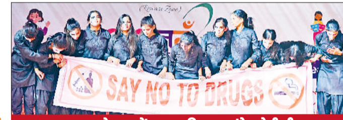
युवा महोत्सव में नशा मुक्ति का संदेश देती टीम